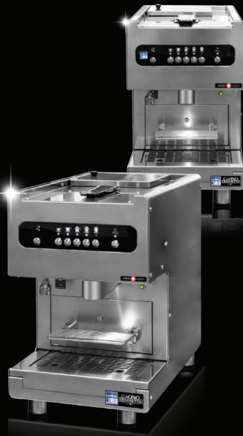
C L B 1 professional